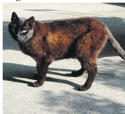
Zugelaufen: Wer vermisst ihn?

Walenstadtberg. – Ende Juli ist in Garadur am Walenstadtberg dieser kastrierte, 8 bis 10 Jahre alte Kater, zugelaufen, wie die Cat-Box, Katzen-schutzverein Gams, mitteilt. Der Kater war sehr abgemagert, als er dort angekommen ist. Sein Fell ist schwarz mit einem bräunlichen Schimmer. Er ist sehr sozial mit anderen Katzen, überhaupt nicht dominant, lässt sich streicheln, ist aber sonst nicht anhänglich.